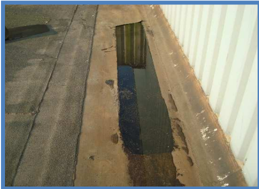
Water tussen onder en toplaag