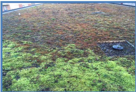
2A + 2B: Mosgroei vs sedumbepanting