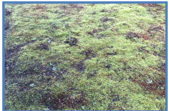
2A + 2B: Mosgroei vs sedumbepanting