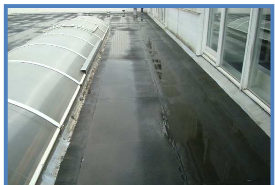
Mos en algen verwijderd