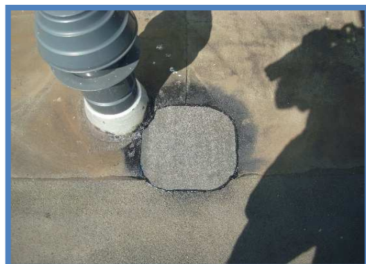
Diverse gebreken hersteld