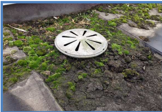
Sprake van veel vervuiling tpv pluvia