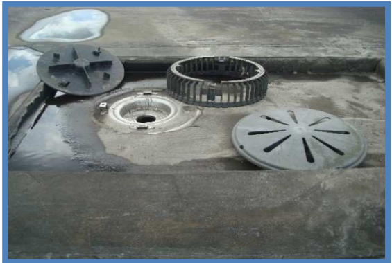
Alle pluvia's ontkoppeld en gereinigd