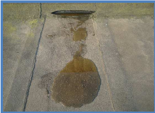
Water tussen onder en toplaag