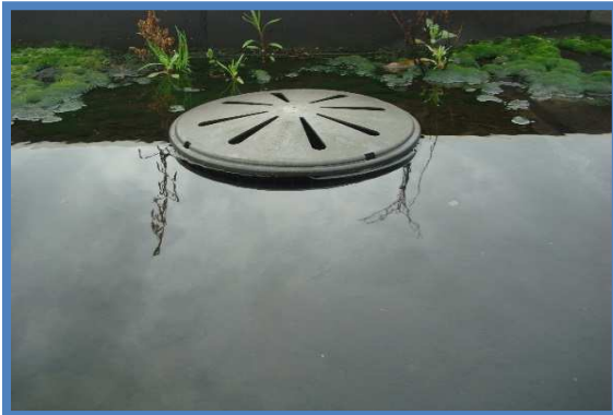
Diverse pluvia's verstopt