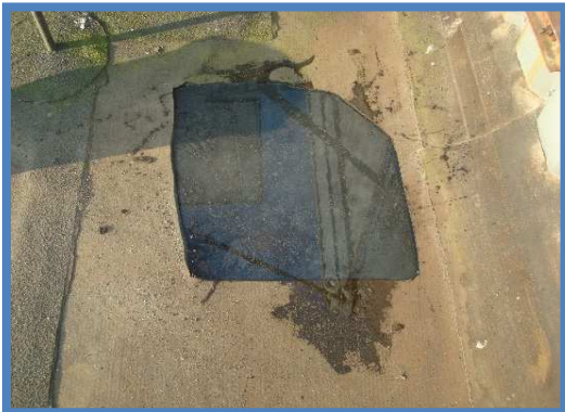
Water tussen onder en toplaag